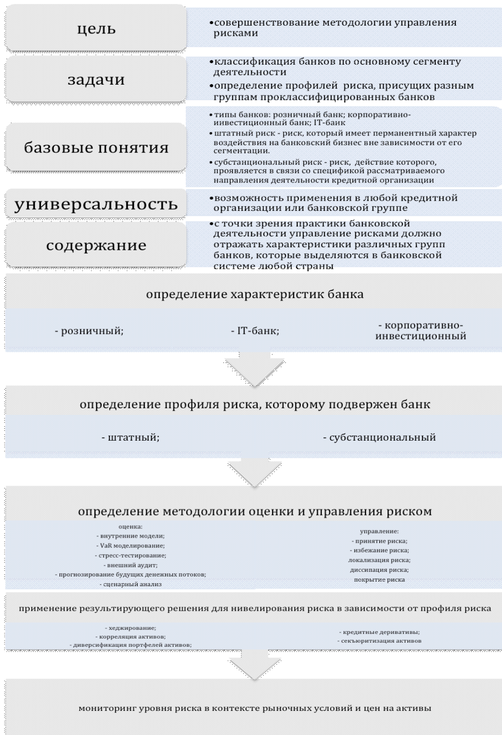
Рис. 3. Алгоритм методологии диверсификации банковских рисков