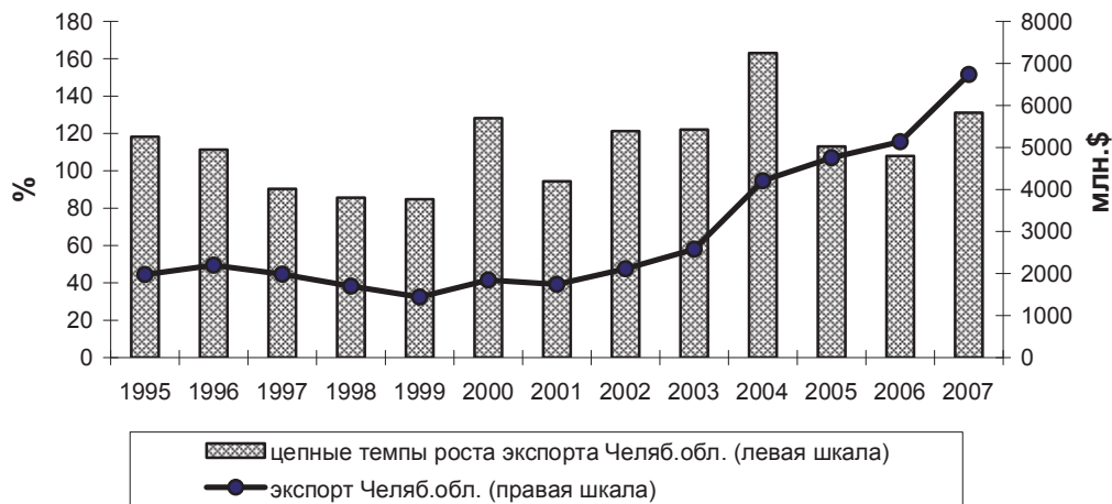
Рис. 1. Динамика экспорта Челябинской области за 1995-2007 гг.

Лимиты на риск являются одним из конечных результатов деятельности подразделения риск-менеджмента металлургической компании и служат для управления рисками, связанными с проводимыми внешнеторговыми операциями. В частности, торговые лимиты представляют собой один из инстру-