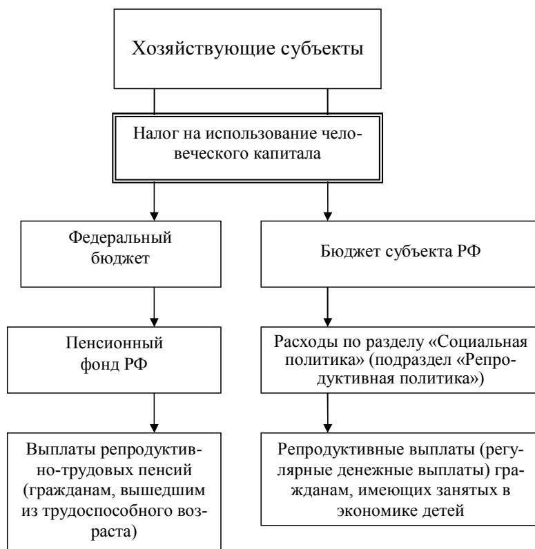
Рис. 2. Предлагаемая система возмещения затрат родительского труда по формированию и развитию человеческого капитала детей

В мировой практике механизмы достижения окупаемости семейных затрат на формирование и развитие человеческого капитала своих детей в основном сводятся к двум: сложившаяся в обществе развитая система помощи детей своим родителям (что характеризует экономические и социальные результаты