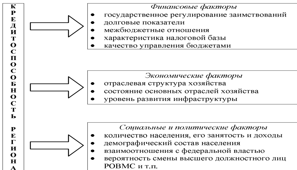
Рис. 2. Структура оценки кредитоспособности муниципального образования