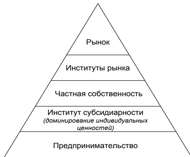
Рис. 1. Пирамида импортированных в Россию экономических институтов (курсивом выделены неформальные институты)

Отсюда следует, что импортируемые институты выступают функцией