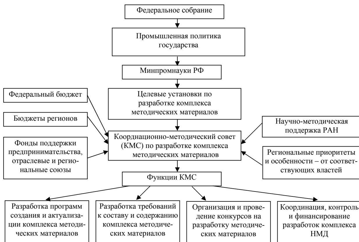
Рис. 2. Схема организации разработки НМД, обеспечивающего хозяйственную деятельность промышленных предприятий и производственного предпринимательства

Рассмотрим в свете этого возможную модель «мягкой» регламентации неформализованных правил и способы поддержания этих правил в действии (рис. 2)