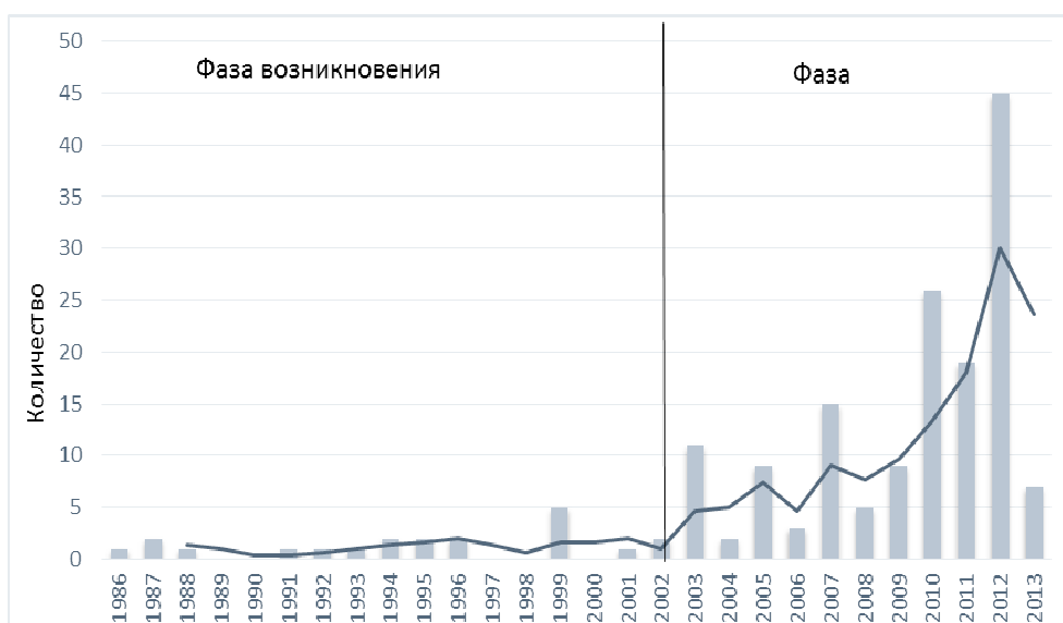
Рис. 1. Развитие исследований социальных инноваций