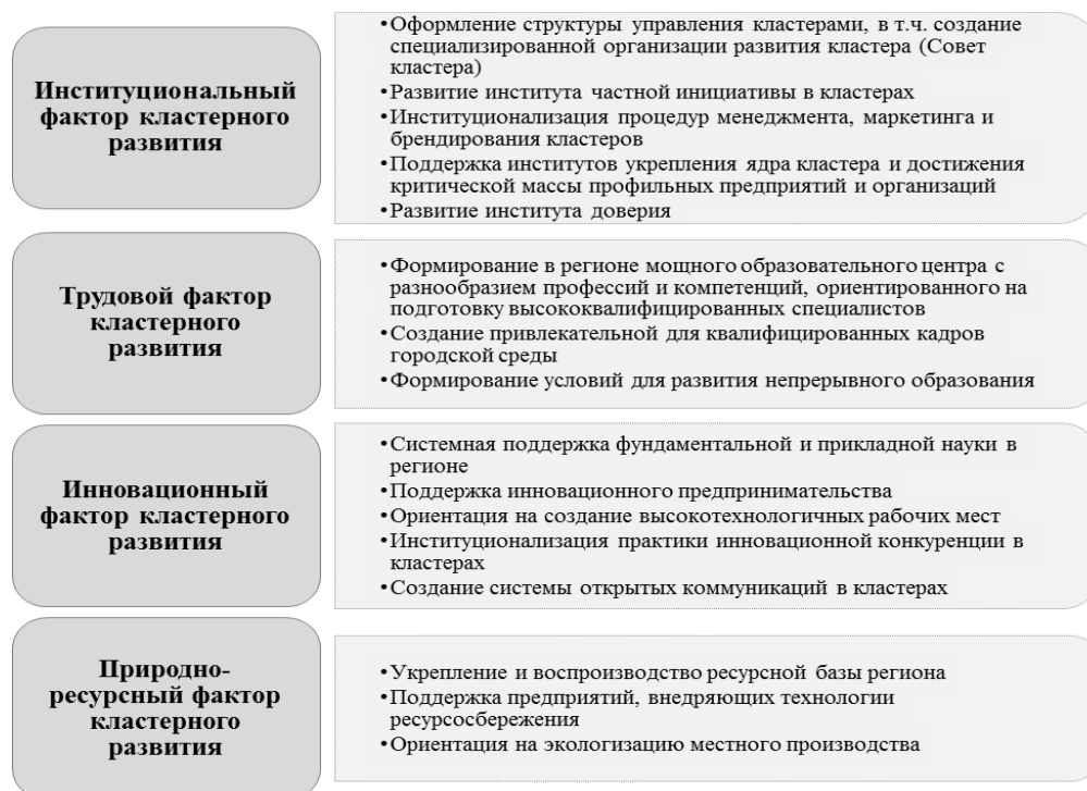
Рис. 3. Базовые направления кластерного развития экономики Пермского края

Выбор направлений для проработки кластерных инициатив (рис. 3) закономерно определили результаты регрессионного анализа: по данным табл. 4, институциональный, инновационный, трудовой и природно-ресурсный факторы экономики Пермского края оказывают благоприятное