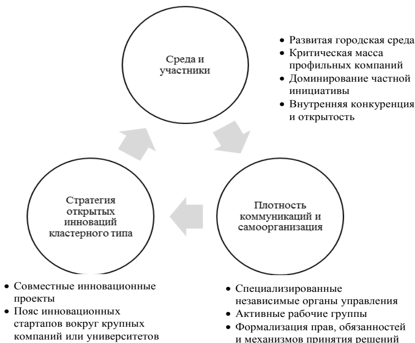
Рис. 2. Модель устойчивого развития кластера Е. Куценко [26, с. 50]

Ю.В. Дубровская и М.И. Ахметова, наряду с внутренними факторами жизнеспособности кластерной структуры, указывают на базовые экзогенные условия эффективной деятельности кластеров: высокоуровневый уровень производственного и научно-технического потенциала регио-