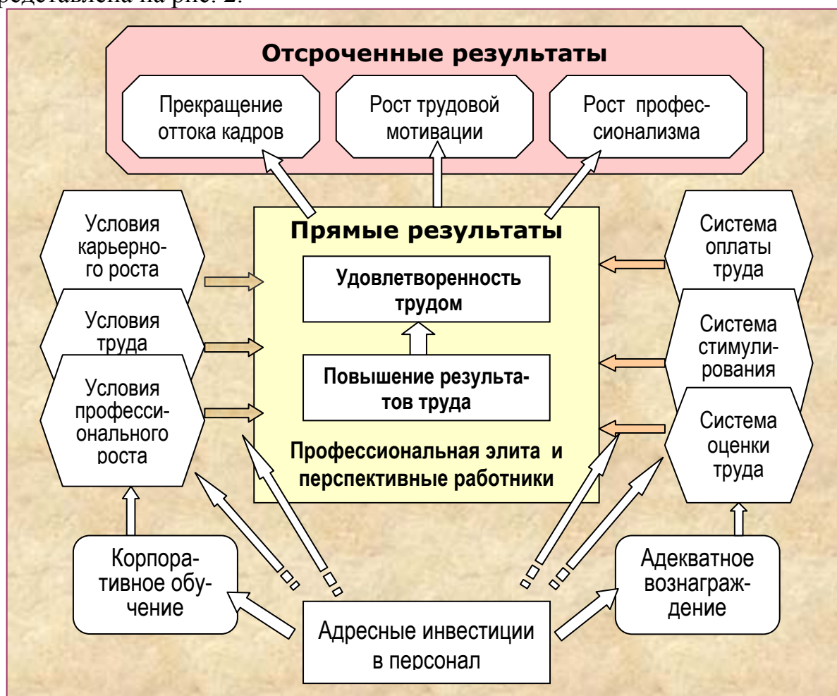
Рис. 2. Влияние адресных инвестиций на персонал

Первое из этих направлений требует кардинальной реорганизации системы оплаты труда и стимулирования. При этом рекомендуется не увлекаться поиском объективных показателей результативности, которые приводят к созданию положений о заработной плате объемом в сотни страниц, а больше доверять оценкам руководителей, через которые они будут показывать собственную профессиональную компетентность и ответственность. Реализация второго направления требует соответствующей кадровой политики и изменений в принципах разработки бюджета предприятия. Общая схема решения данной задачи представлена на рис. 2.