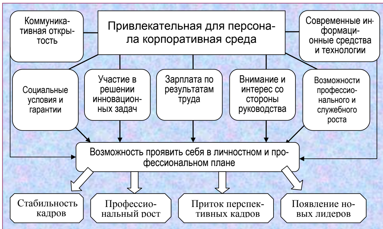
Рис. 1. Влияние корпоративной среды на кадровое состояние предприятия

Современные информационные возможности позволяют квалифицированным работникам менять место работы, не тратя на это много времени и сил. В связи с этим потеря квалифицированного работника становится более вероятным событием для любого предприятия. Чтобы избежать такой угрозы, недостаточно создать условия, соответствующие основным запросам работников (зарплата, офис – всегда найдется тот, у кого они лучше), необходима привлекательная среда, удовлетворяющая многие потребности человека, в которой он реально живет, а не просто выполняет служебные функции. В связи с этим внутренняя среда предприятия, его корпоративная культура становятся предметом специального анализа и проектирования (рис. 1).