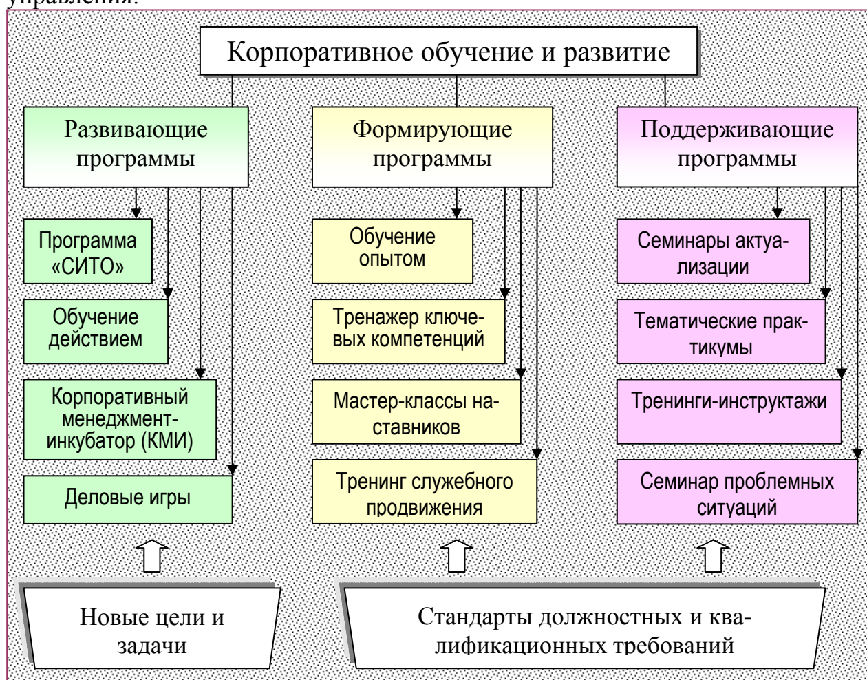
Рис. 3. Виды и методы корпоративного обучения

Наращивание корпоративных знаний – одна из наиболее сложных задач современного менеджмента. Управление корпоративными знаниями необходимо, чтобы повысить эффективность решения производственных задач, которые относятся как к выполнению текущей работы, так и к новым направлениям, связанным с развитием производства, его модернизацией и совершенствованием управления.